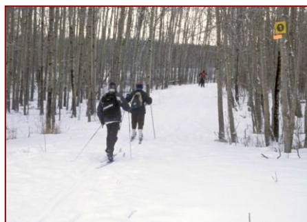
Ski de randonnée