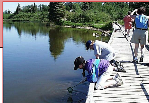
Pêche dans un étang

Communications à l'aide du Bulletin n° 3 et du site Web de Parcs.