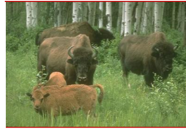
Bison des plaines

Les difficultés du parc et les défis qu'il doit actuellement relever sont décrits de façon plus détaillée dans le rapport de 2010 sur l'état du parc national Elk Island. Si vous avez des points de vue à communiquer à ce sujet ou sur d'autres questions, veuillez nous en informer pour que nous en tenions compte pendant la planification.