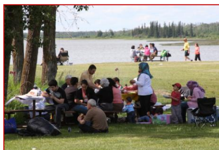
Pique-nique sur la plage Sandy (Parcs Canada)