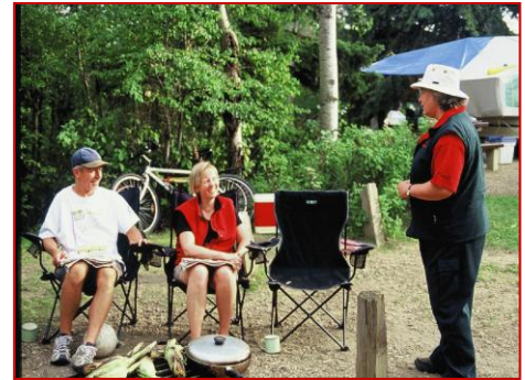
Camping à Sandy Beach (Parcs Canada)

Aire récréative du lac Astotin. Il faut continuer d'améliorer les services aux visiteurs et les programmes, comme les terrains de camping, pour répondre aux besoins et aux attentes des campeurs d'aujourd'hui. Il faut aussi augmenter les possibilités d'interaction entre les visiteurs et le personnel. Un plan d'interprétation sera élaboré pour la Maison du pionnier ukrainien. Le plan de gestion donnera en outre des indications sur l'utilisation future de cette aire récréative.